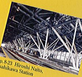
pp.8-23 Hiroshi Naito, Asahikawa Station