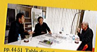
pp.44-51 Table discussion