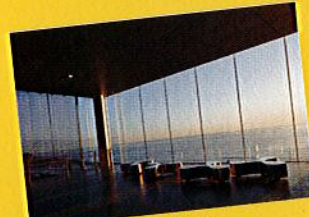
pp.24-35 Kazuyo Sejima, Hitachi Station and Free-Corridor