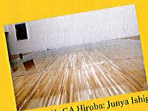
pp.140-141 GA Hiroba: Junya Ishigami