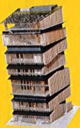
pp.108-119 PLOT: Kengo Kuma, Asakusa Tourist Information Center