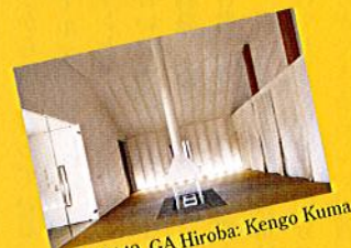
pp.146-149 GA Hiroba: Kengo Kuma