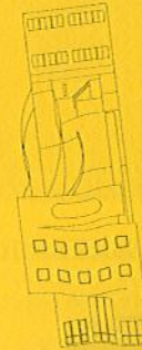
pp.53-56 Special: Toyo Ito