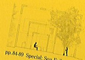
pp.84-89 Special: Sou Fujimoto