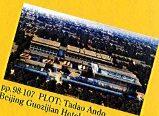
pp.98-107 PLOT: Tadao Ando, Beijing Guozijian Hotel and Museum