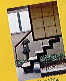
pp.36-43 Waro Kishi, Zohiko Urushi Museum