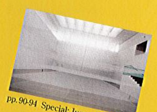
pp.90-94 Special: Junya Ishigami